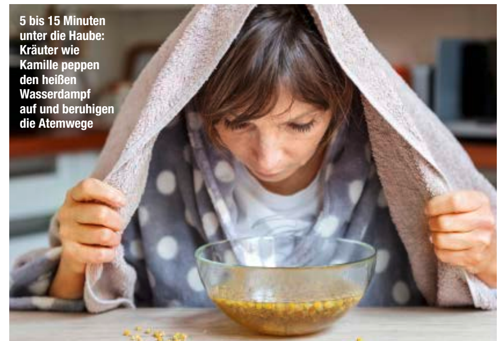
5 bis 15 Minuten unter die Haube: Kräuter wie Kamille peppen den heißen Wasserdampf auf und beruhigen die Atemwege

Wichtig ist vor allem, dem Körper die nötige Zeit zur Regeneration zu geben. Werden die Erkältungsbeschwerden ungewöhnlich stark oder halten sie länger als üblich an, sollte man im Zweifel doch lieber einen Arzt aufsuchen.