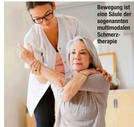
Bewegung ist eine Säule der sogenannten multimodalen Schmerztherapie

Manchmal bleibt ein Schmerz bestehen, obwohl die ursprüngliche Ursache längst verschwunden ist. Schuld daran kann das Schmerzgedächtnis sein: Nervenzellen im Rückenmark und Gehirn speichern wiederholte Schmerzreize wie eine Art neuronale Erinnerung. Eigentlich ein Schutzmechanismus, problematisch wird es, wenn diese „Merker“ überaktiv bleiben.