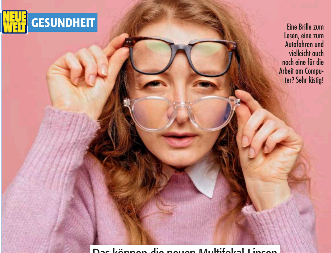
Eine Brille zum Lesen, eine zum Autofahren und vielleicht auch noch eine für die Arbeit am Computer? Sehr lästig!