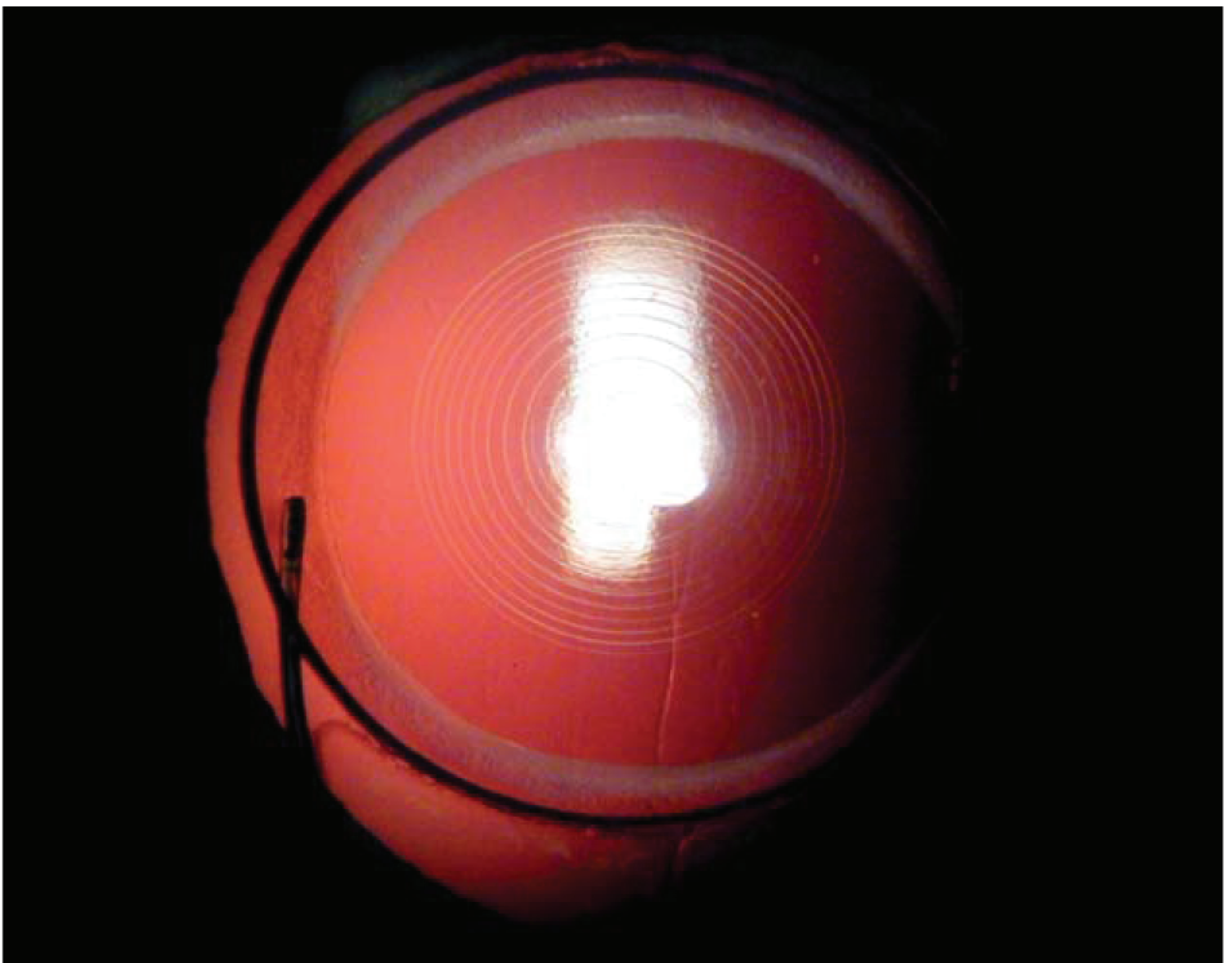
Abb. 1: Die multifokale Kunstlinse im Auge. Die zentralen Ringe erzeugen das Nahbild.

Eine Multifokale Kunstlinse weist mehrere Brennpunkte auf, daher der Begriff „multifokal“. Moderne Multifokallinsen verfügen über drei Hauptbrennpunkte, daher wird auch häufig der Begriff „Trifokal-Linse“ verwendet (Abb. 1).